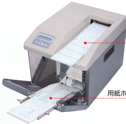
用紙スタッカー部

■当機対応ソフトウェアにつきましては、別途ソフトウェア説明書にてご確認ください。